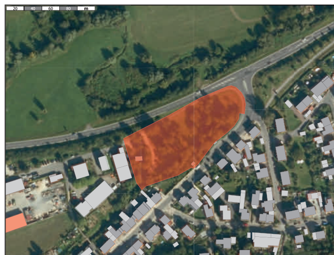
Plan: Gemeinde Memmeldorf, Maßstab 1:1000