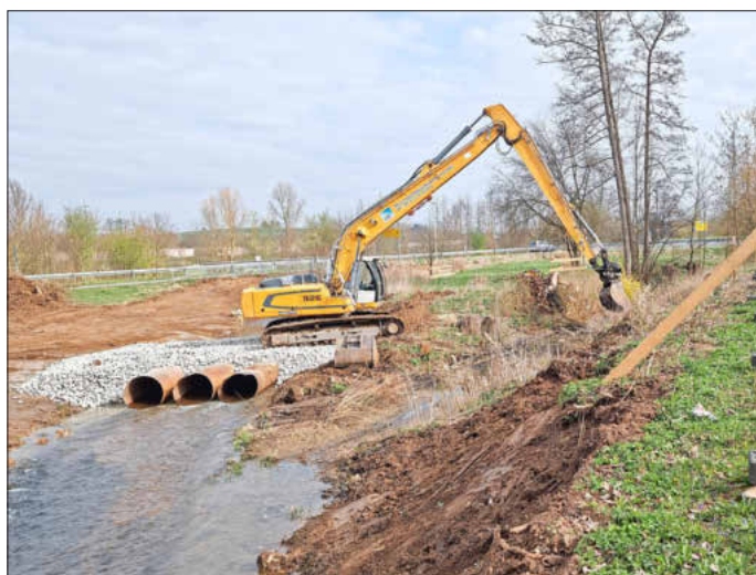
Stand der Erdarbeiten am 20. März, Foto: besc

Ihre Bauverwaltung | Gemeinde Memmeldorf