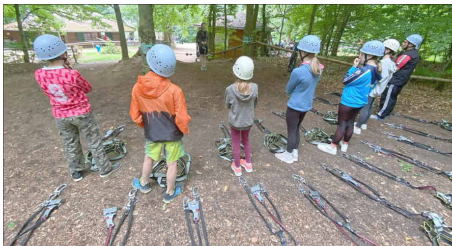
Toben, rennen, klettern – beim Ferienabenteuer gibt es viel zu erleben, Foto: Olli Schulz, Trainings und Outdoors

Bei Kicker, Brettspielen, Biken, Basketball, Juggern oder Fitnesstraining können sich Kinder im Alter von 10 bis 14 Jahren bei den Actionwochen so richtig austoben!