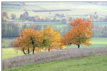
Herbstlandschaft im Ellertal

Im September und Oktober finden wieder zahlreiche geführte Wanderungen und Führungen in der Fränkischen Toskana statt. Eine Anmeldung ist jeweils unbedingt erforderlich bei der Tourist-Info Fränkische Toskana, Tel. 09505-80 64 106, info@fraenkische-toskana.com.