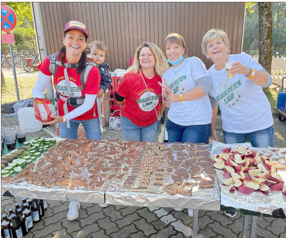
Jung und Alt waren im Einsatz beim Brauereienlauf 2022

Ein Jahr vorher suchen die Veranstalter Tricamp GmbH bereits ehrenamtliche Helfer, die Teil dieses sportlichen Ausnahmeevents sein möchten. Es werden zahlreiche Unterstützer gesucht, z.B. für den Austausch an Versorgungsstationen entlang der Strecke oder im Zielbereich im Festzelt, für organisatorische Aufgaben oder zur Information der Athleten. Auch der Einsatz von Vereinen zur Aufbesserung ihrer Vereinskasse oder von älteren Schulklassen zur Finanzierung ihrer Abschlussfeier wäre möglich. Der Einsatz erfolgt in den Gemeinden Gundelsheim, Strullendorf oder Litzendorf. Für alle gibt es ein Helfer-T-Shirt, Verpflegung während des Einsatzes und zu einem späteren Zeitpunkt eine Helferparty. Darüber hinaus können sich regionale Firmen bereits jetzt über Sponsoring-Möglichkeiten und zielgruppen-gerechte Werbemöglichkeiten vor und während des Brauereienlaufs informieren.