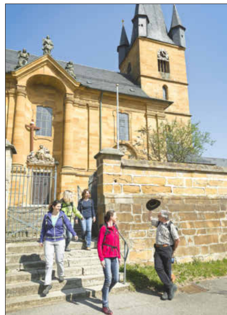
Kirche St. Wenzeslaus in Litzendorf