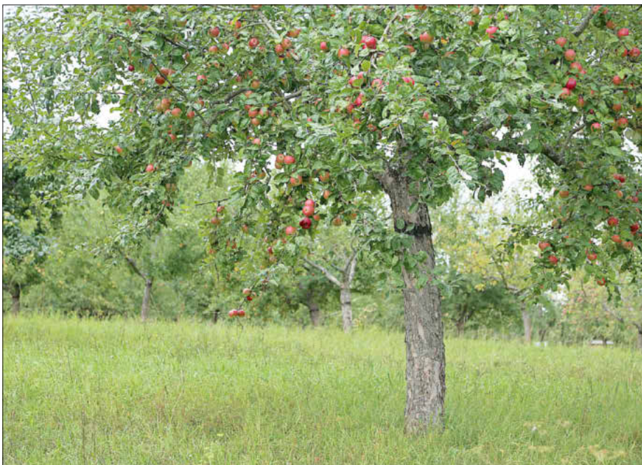
Eine herbstliche Streuobstwiese, Foto: Alexandra Klemisch

Herzliche Einladung zur Schulung „Fachgerechte Pflanzung von Obstbäumen inkl. Pflanzschnitt“ in Kooperation von LPV, der Kreisfachberatung für Gartenkultur und Landespflege und der Gemeinde Memmelsdorf