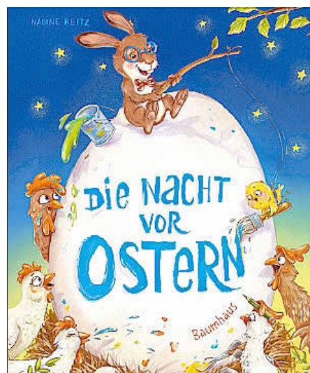
Buchcover, Bastei-Lübbe / Baumhaus & Boje, Illustration von Nadine Reitz

Wir freuen uns auf euren Besuch. Das Büchereiteam