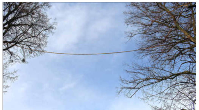
Bald werden hier hoffentlich die Eichhörnchen zu sehen sein ..., alle Fotos: besc

Mit dieser Maßnahme möchte die Gemeindeverwaltung Memmelsdorf nicht nur einen kleinen Beitrag zum Tierschutz leisten, sondern auch das Bewusstsein für Natur- und Artenschutz verstärken. -besc-