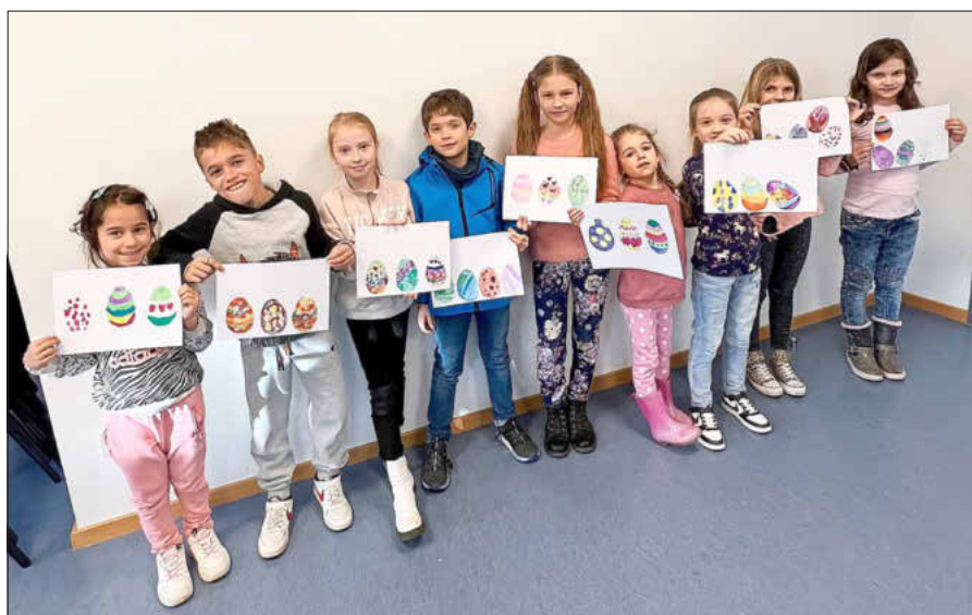
Zeichnen am 19.03.23

Alle Kinder lieben es zu malen. Zeichnen verbessert die Stimmung und entwickelt die Vorstellungskraft.