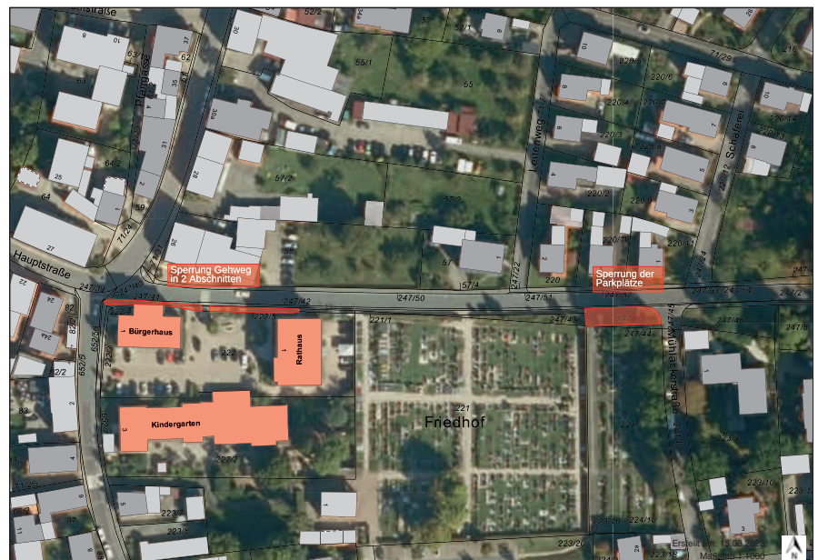
Plan: Gemeinde Memmelsdorf, Maßstab 1:1000

Bei entsprechender Witterung sind die Arbeiten bis voraussichtlich Mitte KW 13 abgeschlossen.