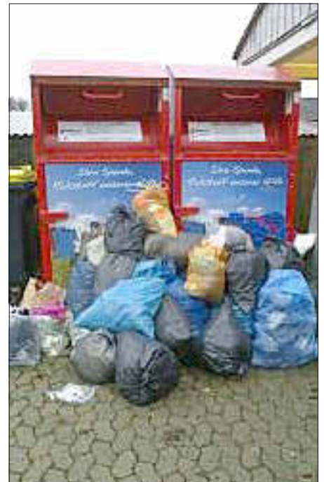
In den vergangenen Wochen wurden illegal Altkleidersäcke am Containerplatz am Bauhof abgelagert, Foto: Gemeinde Memmelsdorf

Nehmen Sie bitte von zu Hause aus gleich eigene Hundekotbeutel mit, am besten aus „Recyclingpapier“! Nur verrottbare Papierbeutel schonen auch unsere Umwelt nachhaltig!!