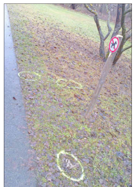
„Unappetitliche“ Hinterlassenschaften am Radweg nach Drosendorf