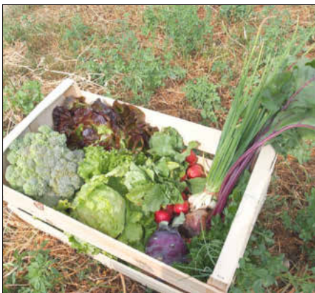
Eine durchschnittliche Gemüsebox der SoLaWi Bamberg