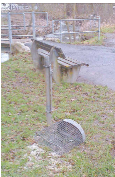
Die mutwillig beschädigten Mülleimer