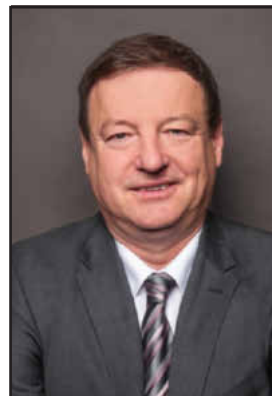
Erwin Baum Immobilienmakler

Lehrerin mit Familie sucht Haus o. Grundstück zum Kauf in Memmelsdorf, bis 700.000 Euro. 0157/39612386 oder familie-krauser@gmx.de