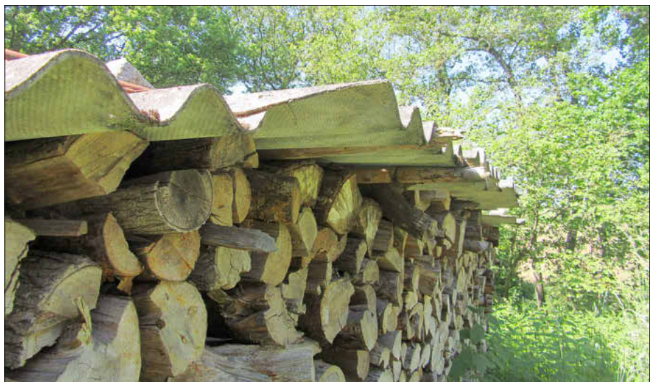
Asbestzementplatten dürfen nicht wiederverwendet werden

Nähere Infos zu dem Thema erhalten Sie unter www.landkreis-bamberg.de/abfallrecht oder der Telefonnummer 0951 85-702 bzw. -704. ■