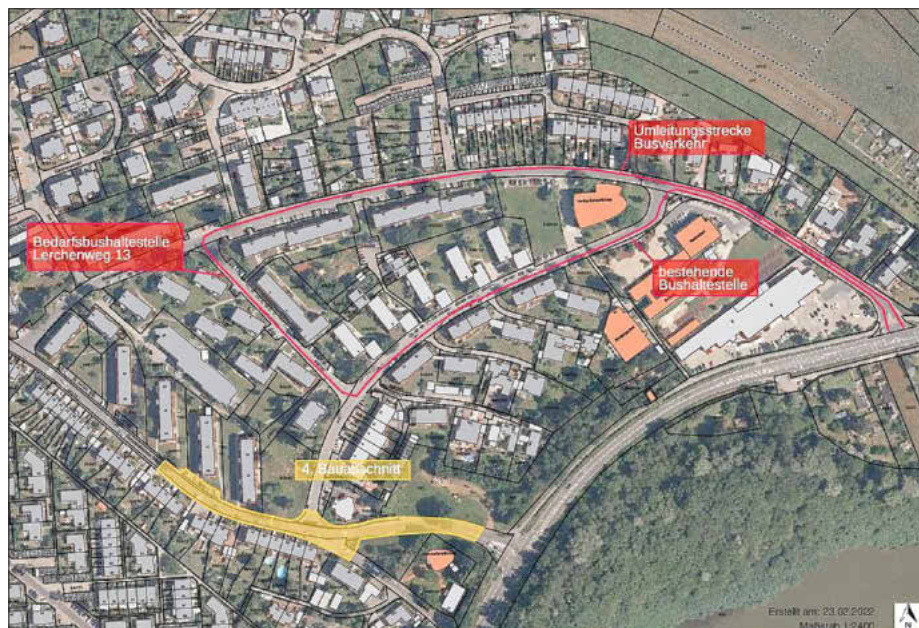
Plan: Gemeinde Memmelsdorf, Maßstab 1:2400

Diese Haltestelle ersetzt die Haltestelle „Stockseestraße“, die während der Sperrung nicht angefahren werden kann