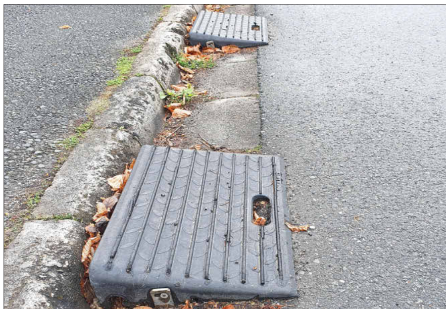
Unerlaubte Anrampungen

Liebe Bürgerinnen und Bürger, immer wieder fallen bei allgemeinen Ortseinsichten unerlaubt angebrachte Anrampungen für die erleichterte Einfahrt in private Grundstücke in Form von Keilen, Kanthölzern, etc. auf.