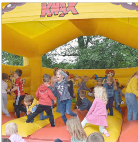
Bei den Kleinsten war die Hüpfburg das Highlight

Bei strahlendem Wetter konnte man am Samstag ebenso strahlende Gesichter rund um die Seehofhalle sehen. Der MCC hat angesichts der ausgefallenen Faschingsveranstaltungen mit einem erstmals durchgeführten Sommerfest eine gelungene Alternative geboten.