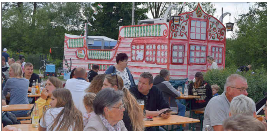
Eine ungewöhnliche Kulisse für Schnapsschüsse bot das MCC Schiff