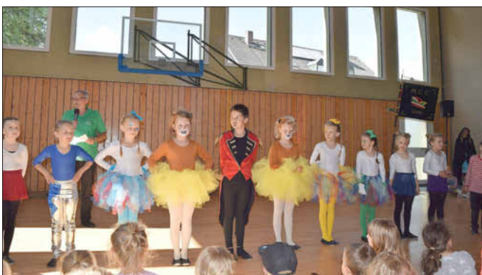
Die Bambinis bedanken sich für den Applaus