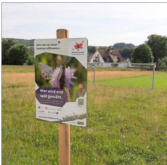
Infoschild „Hier wird spät gemäht“ in Schmerldorf, Foto: C. Hilker

Hoch gewachsenes Gras, bunte Blüten und summende Insekten – so sieht es zurzeit auf einigen Gemeindeflächen aus. Nicht jeder findet diesen „Wildwuchs“ auch gut. Doch er ist wichtig, denn wir brauchen auch in unseren Dörfern mehr Raum für Natur und Platz für Tiere und Pflanzen. Blühende Kräuter und Gräser bieten Nahrung, Unterschlupf und Nisthabitate für Käfer, Schmetterlinge, Kleinsäuger und Co. An manchen Stellen machen extra Info-Schilder darauf aufmerksam, dass hier bewusst später gemäht wird.