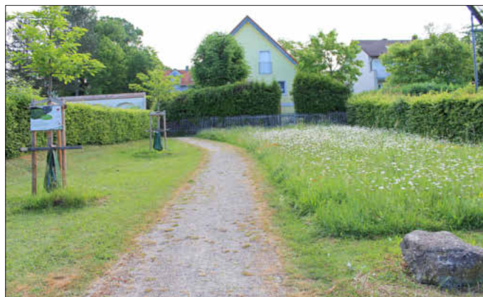
Hier sieht man den Unterschied zwischen früher, häufiger Mahd (li.) und später Mahd, Foto: besc