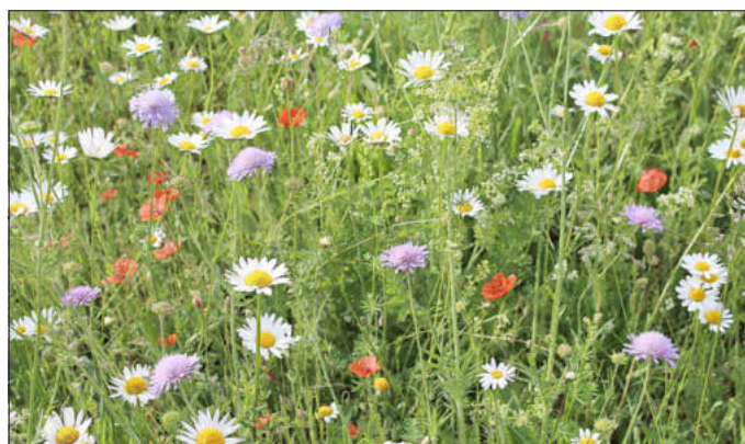
Die Blühwiese am Alten Friedhof Memmeldorf: eine Freude für's Auge und für Insekten, alle Fotos: besc

Bunte Blühflächen mit schöner Blütenpracht Auch im zweiten Jahr nach der Ansaat zeigen sich die vielen Blühflächen in der Gemeinde mit einer prächtigen Blütenvielfalt. Der im letzten Frühsommer vorherrschende Mohn wurde in diesem Jahr abgelöst durch die leuchtend weiß blühende Margerite. Gemischt mit weiteren Arten wie Acker-Witwenblume, Wilder Möhre, Hornklee, Bocksbart - ein leckeres Buffet für Wildbienen. Einige dieser „wilden“ Verwandten der Honigbiene sind echte Feinschmecker. Sie sammeln ihre Pollen nur an ganz bestimmten Pflanzen wie z.B. Glockenblumen oder Korbblütler. Im Gegensatz zu Honigbienen und Hummeln bilden die meisten auch keine Staaten, sondern leben unauffällig als Einzeltiere. Sie sind sogenannte Solitärbienen, das heißt jedes Weibchen baut ein eigenes Nest und versorgt seine Nachkommen mit Pollen.