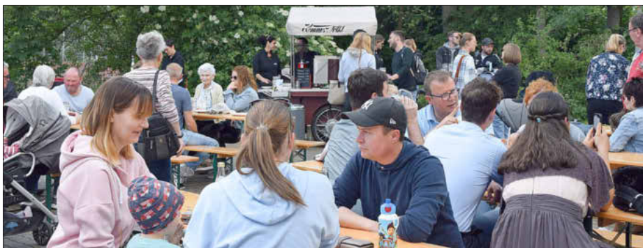
Im Außenbereich genossen die Besucher den Nachmittag