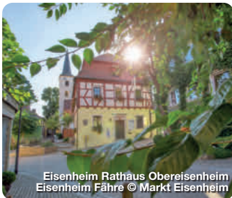
Eisenheim Rathaus Obereisenheim Eisenheim Fähre

Wer an der Mainschleife Zeit verbringt, der sollte unbedingt einen Abstecher in den Markt Eisenheim machen, genauer gesagt, in die beiden Dörfer Ober- und Untereisenheim. Wie zwei Perlen, aufgereiht an der Schnur des Maines, liegen die malerischen Dörfer am Beginn der Mainschleife. Geprägt wird die Gemeinde durch den Wein- und Obstanbau. 60 Winzerfamilien bewirtschaften im Voll- bzw. Nebenerwerb über 230 Hektar Weinberge. Auch sonst haben die beiden Orte einiges zu bieten. Ob im Tal direkt am Fluss oder in den Weinbergen rings um Eisenheim: Wanderer, Radfahrer, Wasserfreunde und Naturliebhaber finden hier paradiesische Zustände vor. TreffpunktDeutschland.de/eisenheim