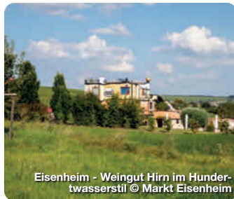
Eisenheim - Weingut Hirn im Hundertwasserstil