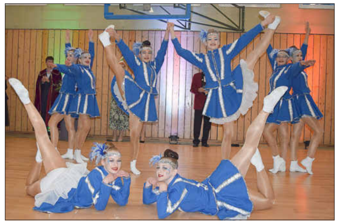
Die Jugendgarde präsentierte ihren Gardemarsch