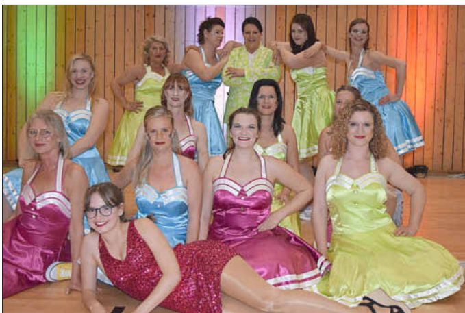
Die MCC-Moms in der Schlusspose ihres ersten öffentlichen Auftritts