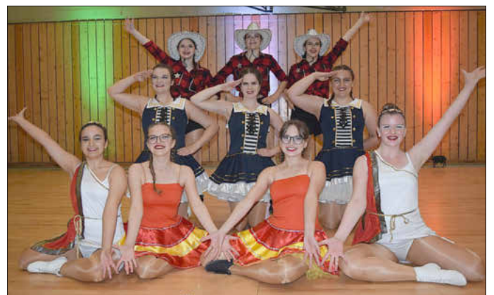
Die Prinzgarde nach ihrem Showtanz