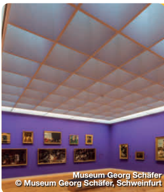
Museum Georg Schäfer