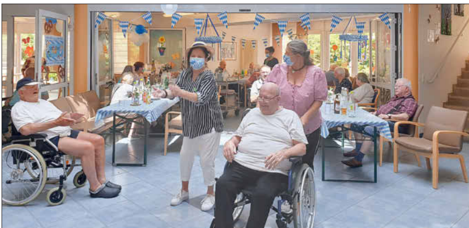
Sommerfest im Seniorenzentrum in Lichteneiche, Foto: GKG

So genossen bei strahlendem Sonnenschein alle Bewohnerinnen und Bewohner gemeinsam ein paar schöne unbeschwerte Stunden. ■