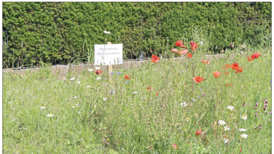
Ein Beispiel für ökologisches Grünflächenmanagement in der Lichteneiche, Foto: besc

Blühende Pflanzen in den Randstreifen von Wegen und Straßen erhöhen das Nahrungsangebot für Hummeln, Bienen und Schmetterlinge und verlängern die Blühzeiten insgesamt, wenn nach der Rapsblüte auf den Feldern nur noch wenig blüht.