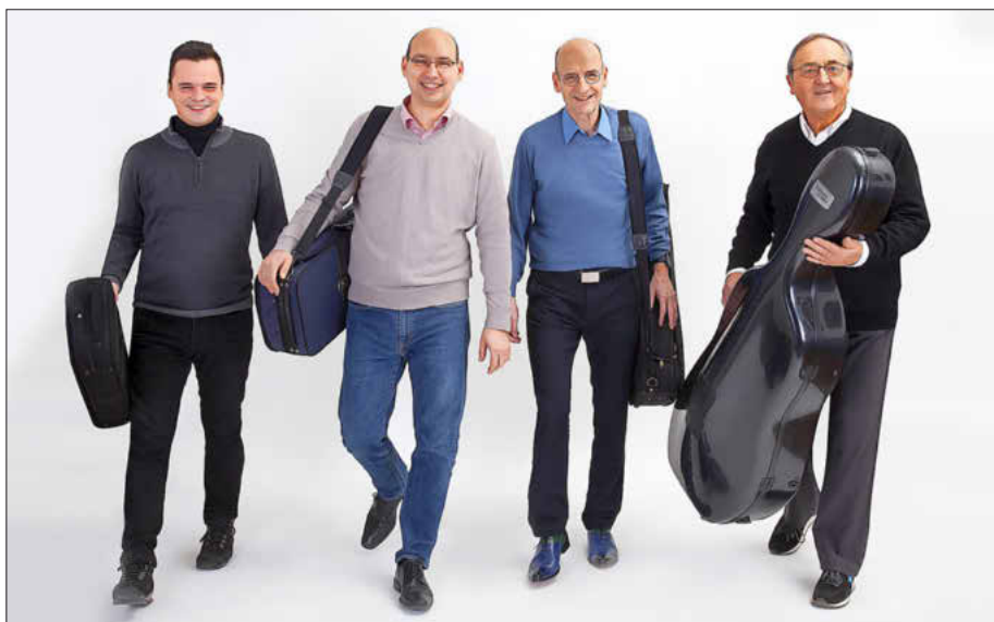
Das Bamberger Streichquartett auf dem Weg ins Schloss Seehof