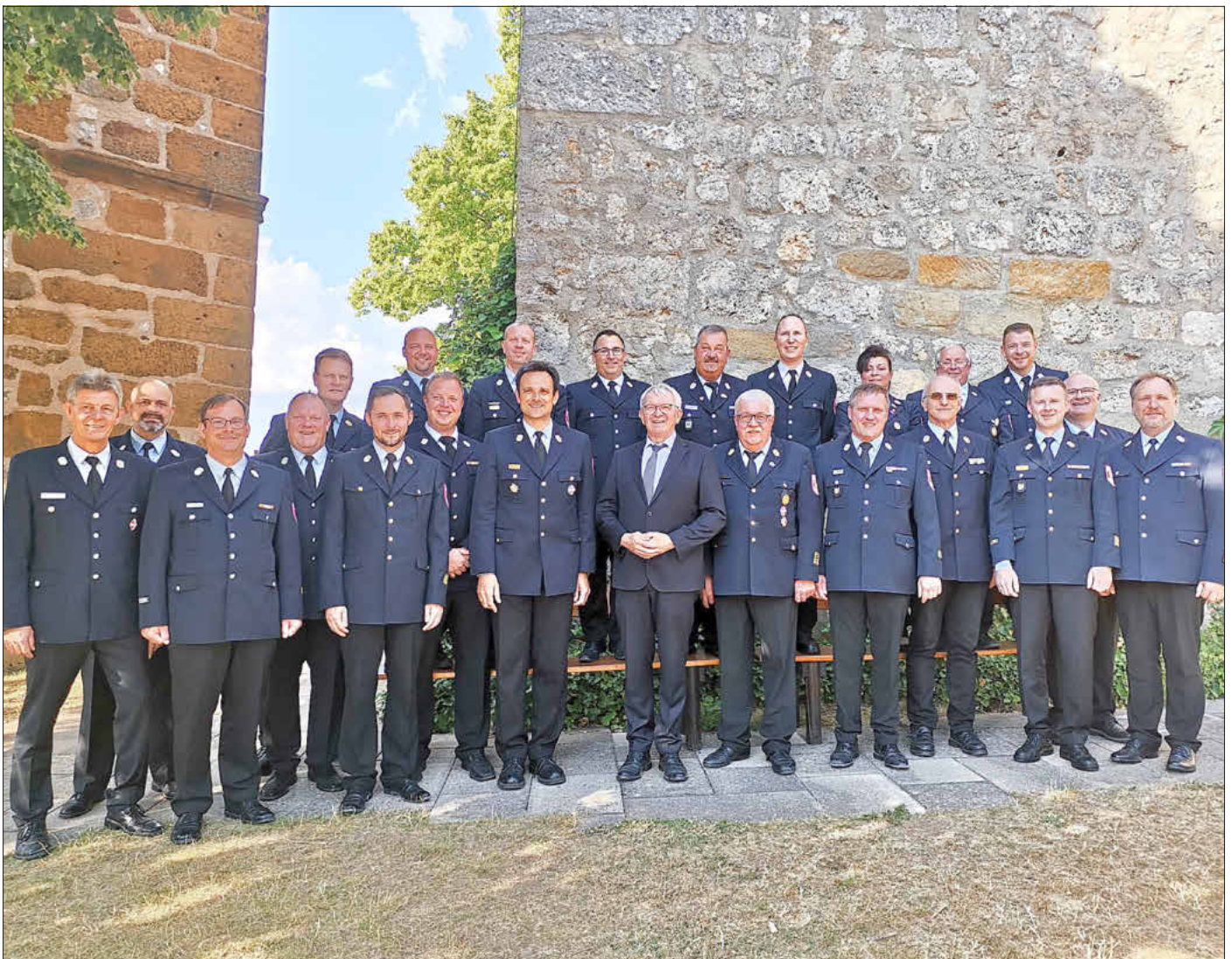
Die „neuen“ und „alten“ Kreisbrandinspektoren beim Festakt auf der Giechburg

Der Kreisbrandrat und die Kreisbrandinspektoren werden von 17 Kreisbrandmeistern und einer Kreisbrandmeisterin unterstützt. Diese sind für einzelne Abschnitte oder für landkreisweite Sonderaufgaben (z. B. Funk, Brandschutzerziehung) zuständig. Gemeinsam mit dem Kreisbrandrat bilden sie die Spitze von insgesamt 6.716 aktiven Dienstleistenden bei den Feuerwehren im Landkreis Bamberg. Alle Funktionen werden ehrenamtlich ausgeübt. ■