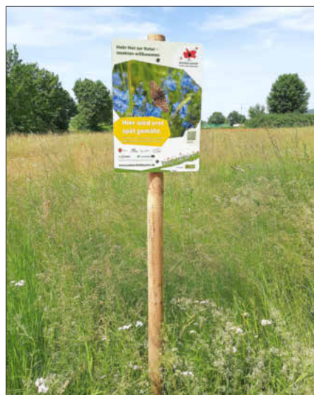
Die Gemeinde Memmelsdorf praktiziert auf ihren Grünflächen aktiven Bienen- und Insektenschutz, Foto: Gemeinde Memmelsdorf

Wegränder dienen also als Rückzugsraum und Unterschlupf für Bienen, Insekten, Kleintiere und Vögel.