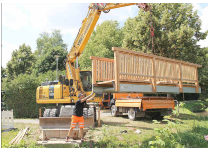
... und der neue gebracht ...