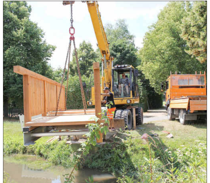
... bald ist es soweit, alle Fotos: besc