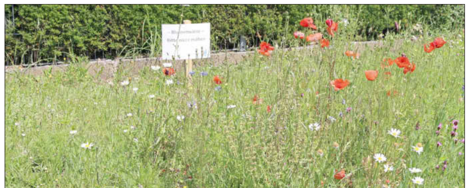
Ein Beispiel für ökologisches Grünflächenmanagement in der Lichteneiche, Foto: besc

Jeder Einzelne kann auch im eigenen Hausgarten viel für Insekten, Vögel und Schmetterlinge tun. Bunte Blumenwiesen helfen Bienen und Co.