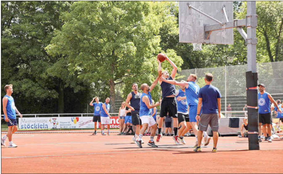
Quattroball: Sportliche Stunden, spannend und fair

Nach einer fast 3 Jahre andauernden Durststrecke fanden sich am Wochenende vom 2./3. Juli endlich wieder weit über 1000 Ballsportler aus ganz Deutschland auf dem Eventgelände des SC Memmelsdorf ein, um die 35. Auflage des Quattroballs auszuspielen. Unter besten äußeren Bedingungen, strahlendem Sonnenschein und der gewohnt malerischen Kulisse vor Schloss Seehof wurden die vielseitigsten Teamsportler in den Disziplinen Basketball, Volleyball, Fußball und Handball gesucht.