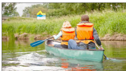
Mit dem Kanu unterwegs auf dem Main

Das 9€-Ticket für Bus und Bahn ermöglicht tolle Naturerlebnisse rund um Bamberg und Lichtenfels! Um nicht immer mit dem Auto unterwegs zu sein, sind viele Wanderwege, aber auch Kanutouren leicht mit den öffentlichen Verkehrsmitteln erreichbar. Das Flussparadies Franken hat schon mal