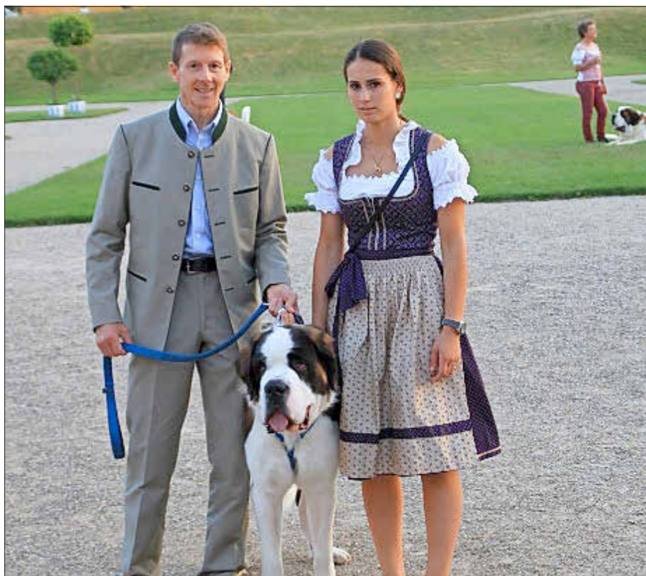
125 Jahre Bernhardiner in Memmeldorf, 2016

Ihre Gemeindeverwaltung Amt Finanzen – Hundesteuer