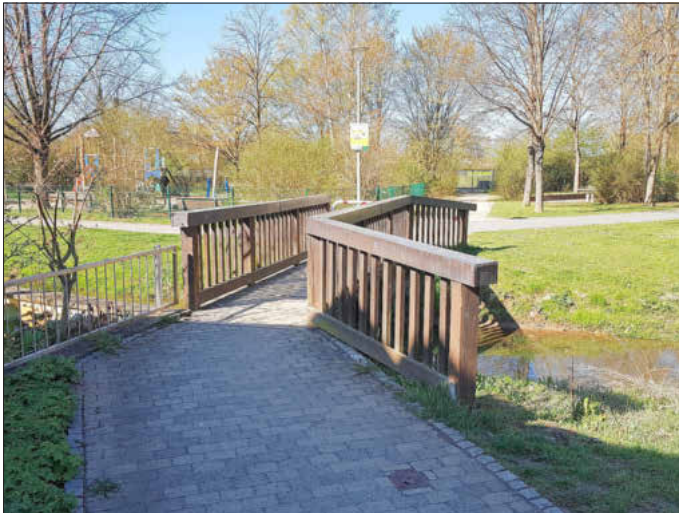
Der Fußgängerweg in der Filzgasse: vorher ..., Foto: Gemeinde Memmelsdorf

Wir sagen unseren Mitarbeitern vom Bauhof ein großes Dankeschön dafür! -besc-