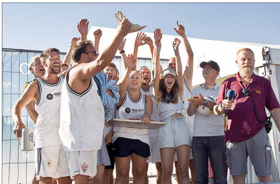
Das Siegerteam „Spätlese“

digen Turnierfavoriten „Ana mit“. Der 12:11 Sieg von „Ana mit“ erwies sich für beide Teams bereits als richtungweisend, denn nur die Gruppensieger, -zweiten und die besten -dritten des Samstags qualifizieren sich für die sonntägliche Gruppe A um den Gesamtsieger auszuspielen. „Ana mit“, nur Gruppendritter am Samstag, dennoch berechtigt für die Gruppe A am Sonntag, verschlug es aber „Die Nullen“ auf den 8. Tabellenplatz und waren dadurch ohne Chance auf den Turniersieg. In Gruppe B dann bereits am Samstag das ständige Fernduell zwischen den beiden Podestplätzen der Spätlese und der Gurgn, welche sich ohne direktes Duell souverän für die Endrunde am Sonntag qualifizierten. Komplettiert wurde die Gruppe A am Sonntag von weiteren Quattrobball-Urgesteinen und Vorjahressiegern wie z.B. Nanigginanei, Bonkers oder den Rabinern.