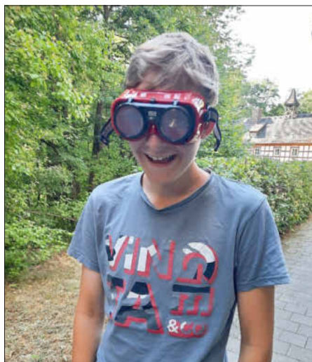
Ein Schüler beim Ausprobieren der „Rausch-Simulationsbrillen“