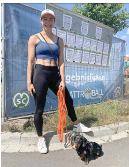
Stargast Sprintstar Gina Lückenkemper

Neben dem Wettergott meinte es auch die Losfee gut und bescherte den zahlreichen Zuschauern bereits zum Startschuss der Spielrunde 1 um 10:00 Uhr am Samstag die prestigeträchtige Handballpartie des Titelverteidigers „Die Nullen“ gegen den stän-