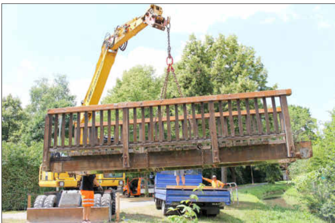
Der alte Steg wird entfernt ...