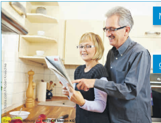
Eine Veröffentlichung der WITTICH Medien KG