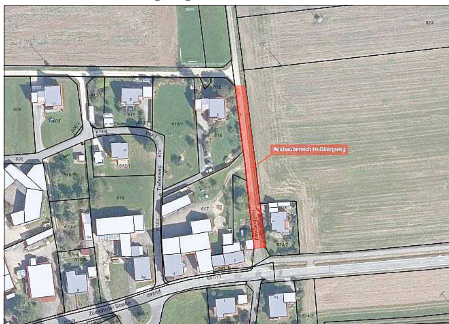
Plan: Gemeinde Memmelsdorf

Aufgrund von Straßenbauarbeiten am Hoßbergweg in Laubend muss dieser voraussichtlich ab Montag, den 29.08.2022 für ca. 12 Wochen sowohl für den Durchgangs- als auch für den landwirtschaftlichen Verkehr gesperrt werden.