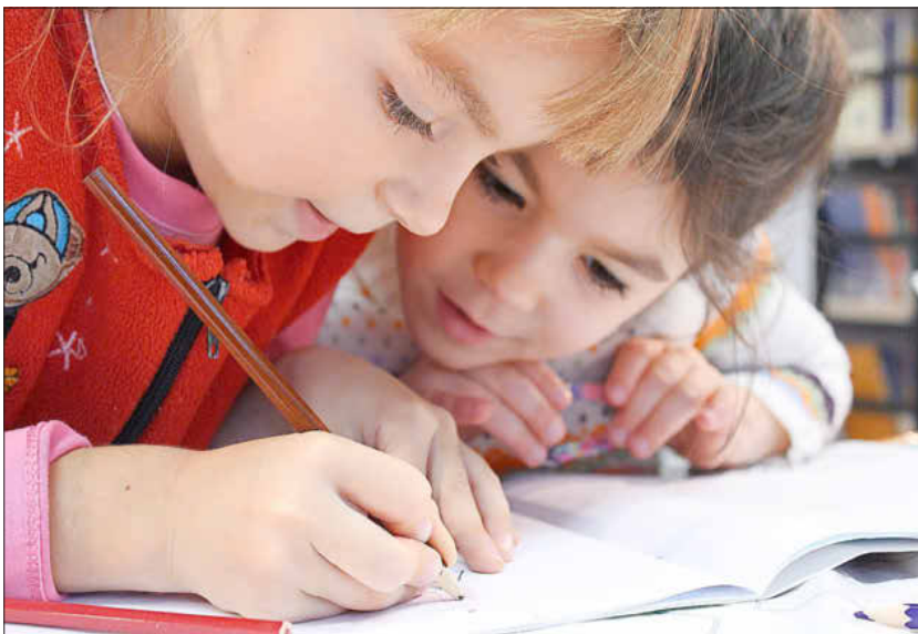
Am 13. September 2022 beginnt die Schule wieder, Foto: svklimkin / Pixabay

Nach den Sommerferien geht's am 13. September wieder los in der Schule! Zu Beginn des Schuljahres sind daher auch wieder viele ABC-Schützen unterwegs und schlechte Wetterbedingungen mit Nebel und Regen erschweren den Schulweg. Schulanfänger sind Verkehrsanfänger, sie gehören im Straßenverkehr zu den besonders schwachen Verkehrsteilnehmern .