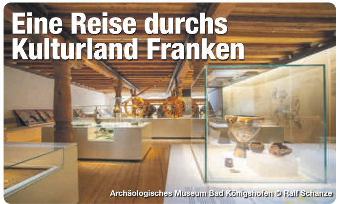
Archäologisches Museum Bad Königshofen