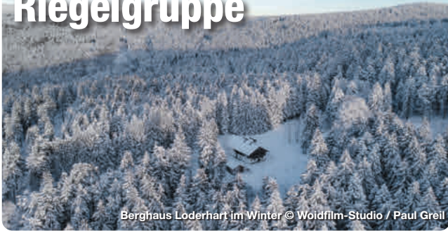
Berghaus Loderhart im Winter