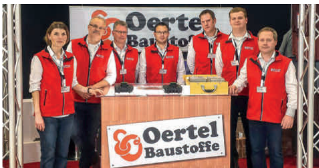
Das Verkaufsteam der Firma Oertel Baustoffe

Sie wollen bauen, sanieren oder Ihre Außenfläche neu gestalten? Dann sind wir, die Firma Oertel Baustoffe, der richtige Partner für Sie!