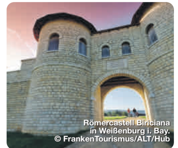
Römercastell Biribiana in Weißenburg i. Bay.

Zahlreiche archäologische Funde zeugen vom einstigen Leben der Römer im heutigen Franken. Zum Beispiel verlief hier der Obergermanisch-Raetische Limes, die nördliche Grenze des römischen Reiches, auf einer Länge von 158 Kilometern. Seit 2005 ist das größte Baudenkmal Europas UNESCO-Weltkulturerbe. Entlang der ehemaligen Grenzanlagen haben Besucher vielfältige Möglichkeiten, das Erbe der antiken Großmacht zu erkunden. Rekonstruktionen römischer Bauten oder Museen mit Römer-Schätzen gibt es im Naturpark Altmühltal, im Fränkischen Seenland, im Romantischen Franken, im Spessart-Mainland oder auch im Fränkischen Weinland ( www.frankentourismus.de/unesco-welterbe/limes ). Die Spuren der Kelten werden heute noch an vielen Stellen sichtbar – ganz besonders entlang des Kelten-Erlebnisweges. Die Strecke ist 261 Kilometer lang und führt unter anderem durch die Haßberge und den Steigerwald bis zum Aischgrund. Auf dem Weg finden sich Überreste keltischer Siedlungen, Grabhügel und Museen mit altem keltischem Handwerk ( www.kelten-erlebnisweg.de ). TreffpunktDeutschland.de/franken