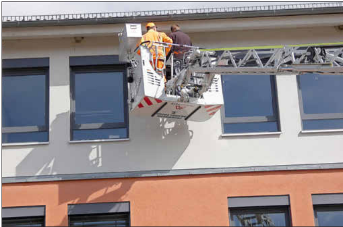
Anbringen der neuen Nisthilfen in luftiger Höhe