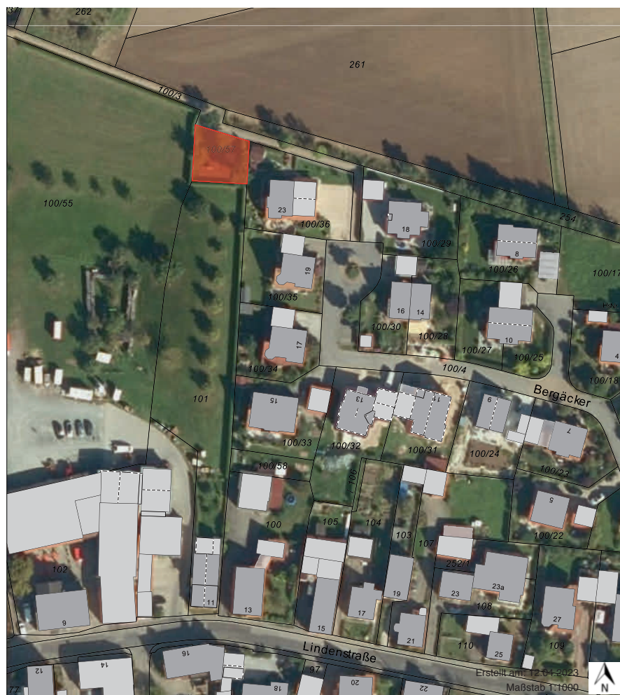
Plan Gemeinde Memmeldorf - Maßstab 1:1000