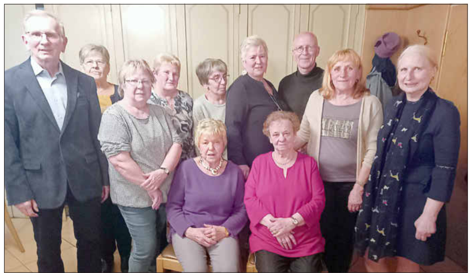
Die Vorstandschaft, alle Fotos: VdK Drosendorf-Merkendorf