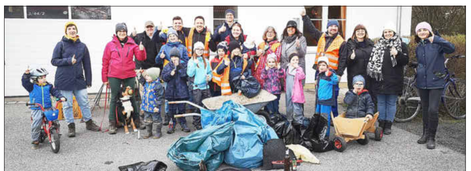
Die fleißigen Helfer beim Rama Dama

Mit gleich drei Aktionen begrüßte Meedendorf den Frühling. Mittlerweile 10 jährige Tradition hat bereits die jährliche Aufräumaktion „Rama Dama“ , die federführend von Markus Prediger organisiert wird. Dieses Jahr sind vier Gruppen von Kindern und Jugendlichen durch Wald und Flur gestreift, um Unrat aufzusammeln. Mit redlich verdienten Würstchen und „Schabeso“ (Limo) ist der Nachmittag noch zünftig ausgeklungen.