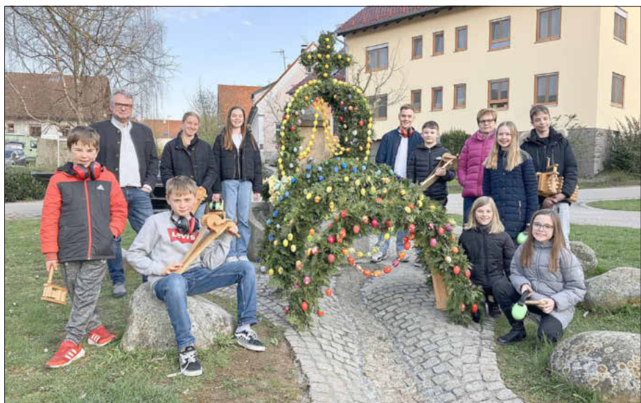
Die Ratschenkinder vor dem Osterbrunnen in Meedensdorf