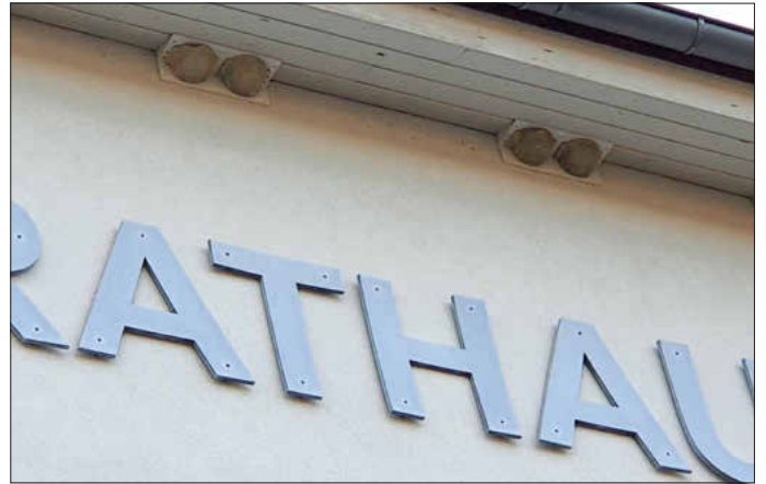
Die neuen Schwalbenhotels am Rathaus können ab sofort bezogen werden, Foto: besc

Dabei bringen diese als „Glücksbringer“ geltenden Vögel auch viele Vorteile mit sich, gerade in mückengeplagten Gegenden. Denn sie fressen Stechmücken. Außerdem kann der Kot der Schwalben als natürlicher Dünger auch im eigenen Garten und auf Blumenbeeten ausgebracht werden.