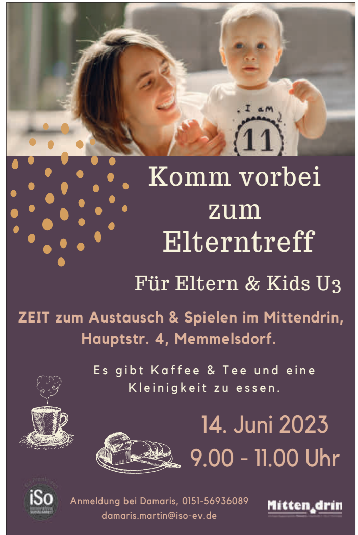
Alle Grafiken: Mittendrin