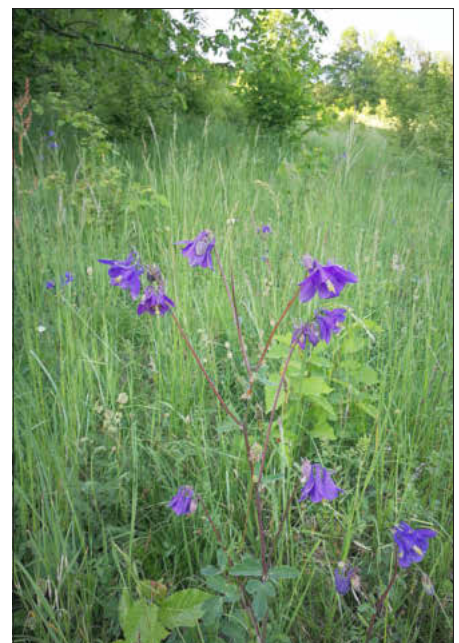
Blühende Pflanzen im Ellertal

Länge ca. 2 km, Unkostenbeitrag 10 Euro. Treffpunkt am Wanderparkplatz links vor Tiefenellern an der Ammonit-Schnecke. Anmeldung unbedingt erforderlich beim Veranstalter: Kräuterpädagogin Elisabeth Fröhlich, elisabethfroehlich@t-online.de