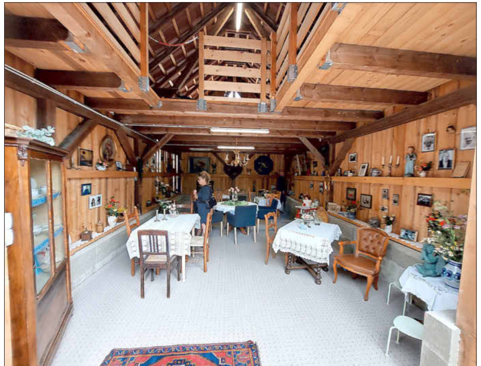
Die sog. Brehmscheune ist ein richtiges Schmuckstück

Ganz besonders möchten wir uns auch bei Herrn Pfarrer Barthelme bedanken. Dass dieser Ort durch ihn geweiht und unter Gottes Schutz gestellt wurde, ist uns besonders wichtig. Dieser Segen soll durch alle Zeiten in diesem Gebäude erlebbar und spürbar sein!