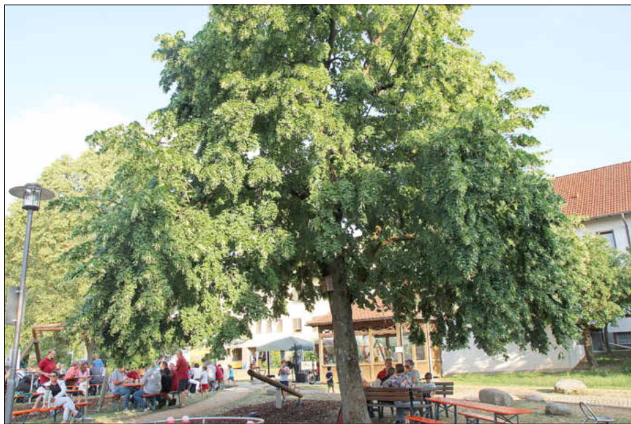
Lindenfest 2023