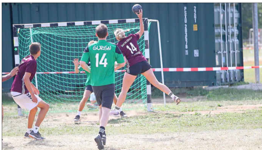
Handball: Quattro Cerveza (rot) GURGN (grün), Foto: Helmut Keiling

Im Turnierverlauf des Samstages setzten sich erwartungsgemäß alle der ausgemachten Favoriten an die Spitze ihrer jeweiligen Gruppe. Neben dem Topfavoriten der Spätlese erreichten die Rabiner und die Nullen die Gruppe A, ebenso auch der Vorjahresvize die GURGN und Spartak Jena sowie die Quattro(aliko)holic. Aus der Vorrundengruppe C setzten sich Ana mit, Nanigginanei und die Gruppe N'87 an die Spitze. Komplettiert wurde das Rennen um die Gesamtplätze 1-16 von den Teams Bonkers, Maingeister, Quattro Cerveza, Gemma Gemma Voigas, den Peulendorfer Haien und