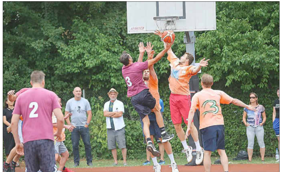
Basketball: 9 andere Quattrottel (orange) gegen die Maingeister (rot)

Im Nachgang des Turniers zeigten sich alle Verantwortlichen des SC Memmelsdorf höchst zufrieden mit dem Verlauf des Turniers. Ein besonderes Lob gilt allen Teams und den mitgereisten Unterstützern für ihr vorbildliches und freundliches Verhalten über das gesamte Wochen-