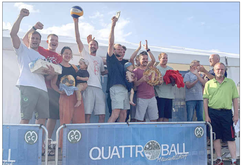
Die Siegermannschaft bei der Siegerehrung des Quattroball-Turniers 2023, Foto: Michael Werner

ende auf der Anlage rund um die Seehofhalle Memmelsdorf.