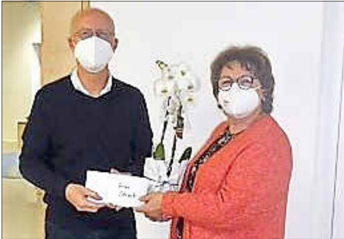
Bürgermeister Gerd Schneider bedankt sich im Namen der Gemeinde herzlich mit Blumen und einem Gutschein