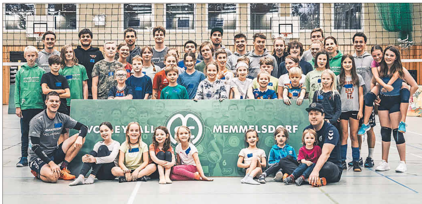
Der Jugendförderpreis des Bayerischen Volleyballverbandes auf Bezirks- und Landesebene geht an den SC Memmelsdorf

Der BVV-Jugendförderpreis des Jahres 2021 geht nach Memmelsdorf in Oberfranken. Unter allen Bezirkssiegern setzte sich am Ende der siegreiche SC Memmelsdorf gegen traditionsreiche Vereine im Süden Bayerns erfolgreich durch.