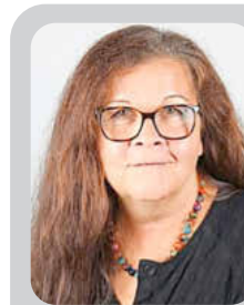
Kontakt Gisela Ruschig

Der „milde“ Verlauf äußert sich gegenwärtig in steigenden Einweisungen von COVID-Erkrankten auf den Normalstationen, und es besteht dadurch ebenfalls die Gefahr, dass unser Gesundheitssystem kollabiert. Die aktuellen Zahlen zeigen auch wieder steigende Einweisungen auf den