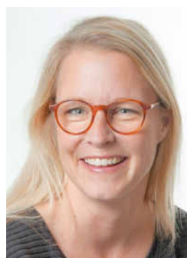
Ina Greß, 3. Bürgermeisterin der Gemeinde Memmelsdorf