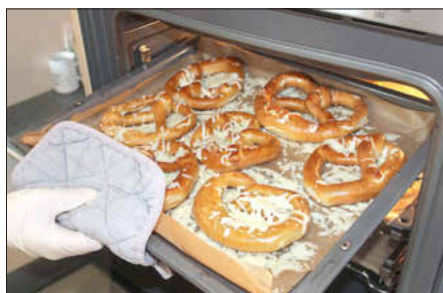
Die Klasse 7a hat selbst Brezeln zum Verkauf am 21. März gebacken