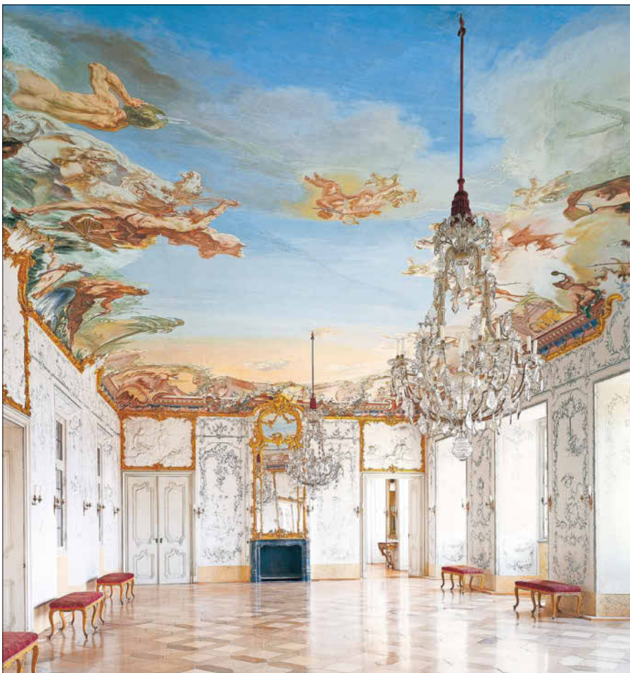
Weißen Saal, Schloss Seehof, Foto: © Bayerische Schlösserverwaltung

Ab April sind im Schloss Seehof eine Ölskizze zur Neptun-Gruppe des Deckengemäldes im Weißen Saal von Giuseppe Appiani , ein Portrait des Fürstbischofs Johann Philipp Anton von Frankenstein , eine fränkische Rokokokommode sowie zwei Wandappliken zu sehen. Diese stammen aus dem Gartenappartement des seit dem Ende des 19. Jahrhunderts nicht mehr existierenden sogenannten Frankenstein-Pavillons. Ein Sofa , das zur ursprünglichen Ausstattung des Audienzimmers gehörte, kehrt aus den Depotbeständen der Würzburger Residenz zum Schloss Seehof zurück und komplettiert nahezu die Ausstattung.