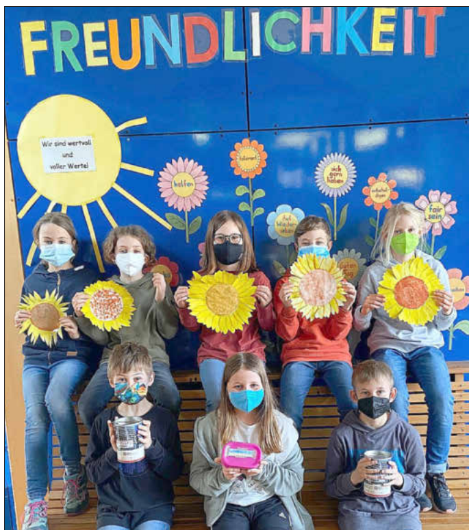
Die Aktion der Klasse 4d