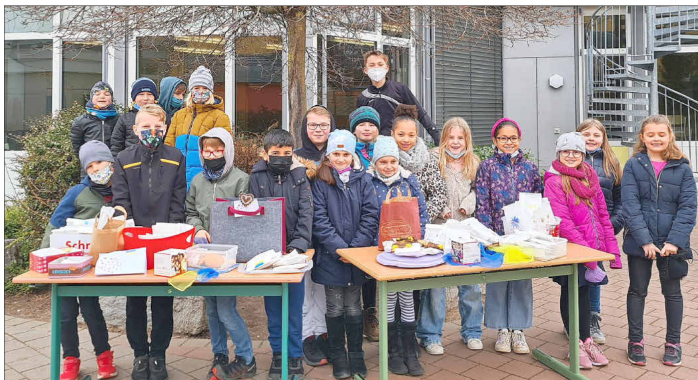
Die Klassen 3a beim Pausenverkauf der Ferdinand-Dietz Grund- und Mittelschule Memmelsdorf

Schülerinnen und Schüler der Ferdinand Dietz Grund- und Mittelschule helfen mit