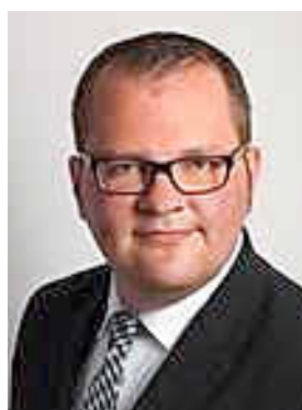
Jürgen Reinwald, 2. Bürgermeister der Gemeinde Memmelsdorf