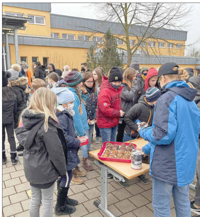
Am 15. März verkauften die Kinder der Klasse 5a in der ersten Pause Muffins