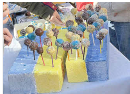
Die Aktion der Klasse 4a

Am 1. April endet die Aktion mit einem Kuchenverkauf der OGTS in Zusammenarbeit mit der JAM auf dem Rathausplatz. Bereits jetzt sind mehr als 500 € an Spenden zusammengekommen – das Endergebnis gibt es dann auf der Homepage der Schule.