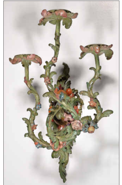
Dreiflammiger Leuchter in Blumenformen, Schloss Seehof, Memmelsdorf, alle Fotos: © Bayerische Schlösserverwaltung