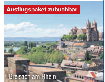
Breisach am Rhein

Ihr Hotel erwartet Sie nahe der deutsch-französischen Grenze und verfügt über ein Restaurant, eine Bar, eine Terrasse sowie Abstellmöglichkeiten für Fahrräder und Motorräder.