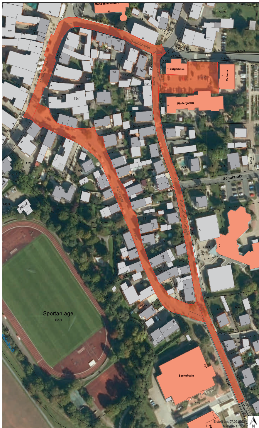
Plan: Gemeinde Memmeldorf

Wir bitten um Beachtung. Ihre Gemeindeverwaltung Memmeldorf