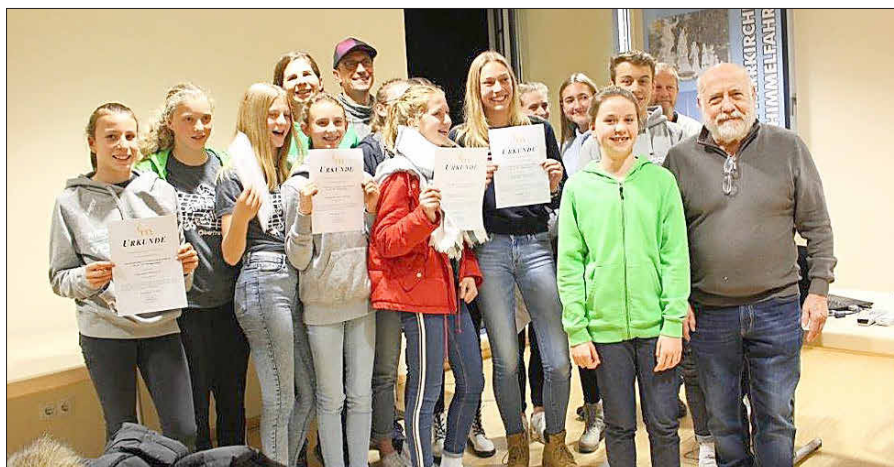
Ehrungsabend 2019

An diesem Abend zeichnet die Gemeinde sowohl erfolgreiche Sport-