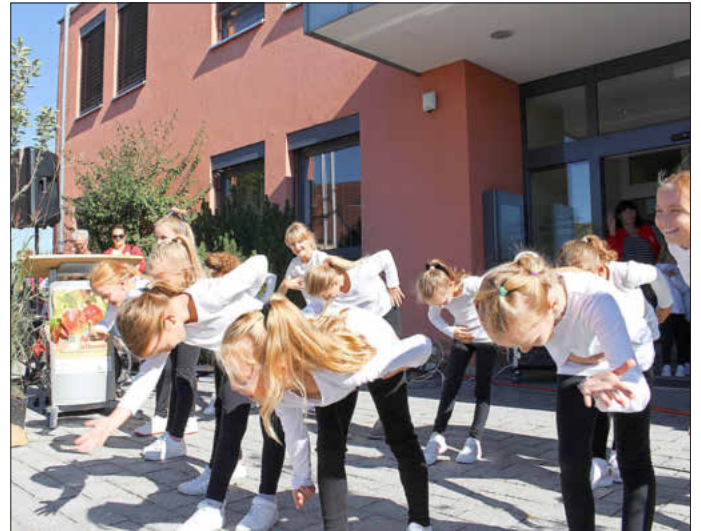
Die Mädchen von der Tanzgarde des MCC begeisterten das Publikum