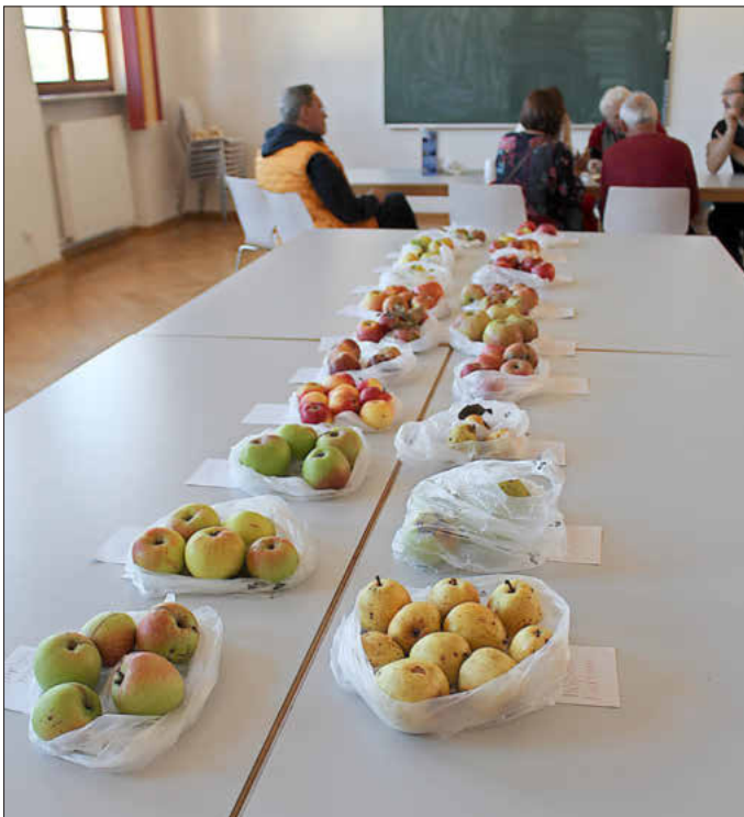
Sortenbestimmung im Bürgerhaus