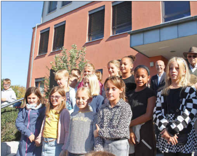
Abschlusslied durch Schüler und Schülerinnen der Ferdinand-Dietz-Schule Memmelsdorf