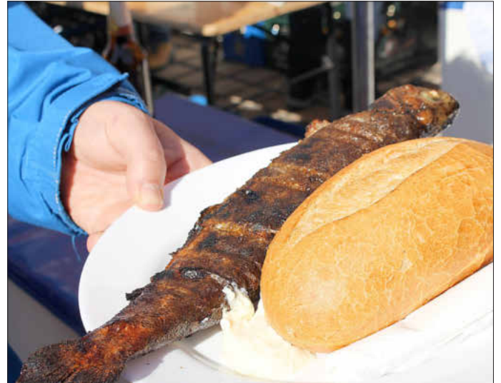
250 Fische grillte und verkaufte allein die Feuerwehr Drosendorf