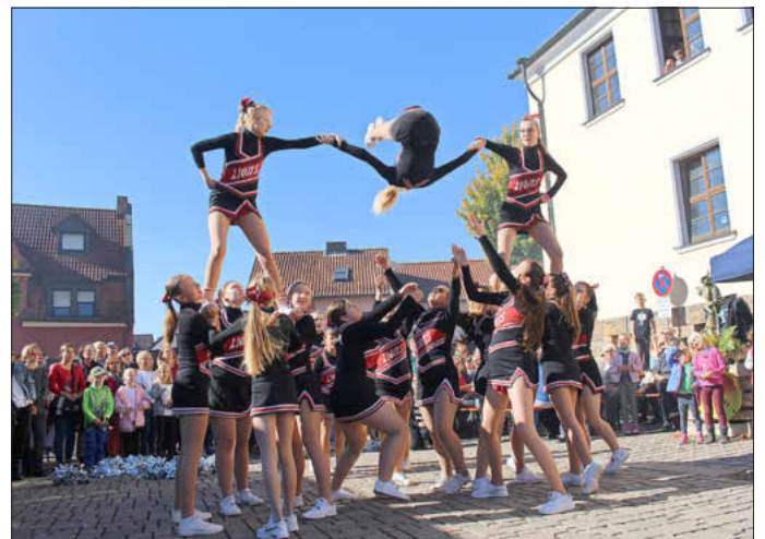
Die waghalsige und gekonnte Vorführung der Cheerleader von der Basketballgemeinschaft Litzendorf