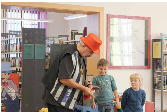
Im Bürgerhaus brachte ein Zauberer Groß und Klein zum Staunen