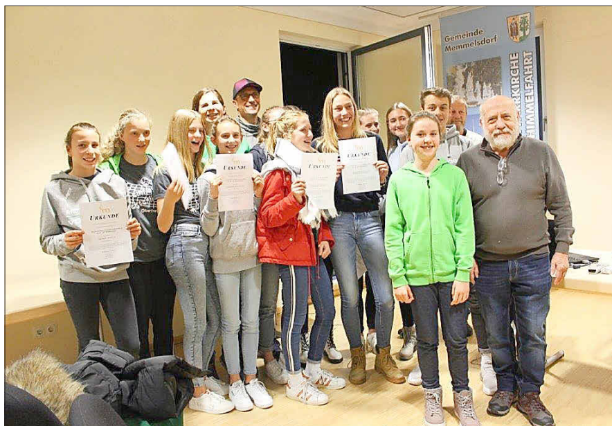
Ehrungsabend 2019, Foto: besc

Bitte melden! Erster Bürgermeister Gerd Schneider: „Der öffentliche Ehrungsabend liegt mir persönlich sehr am Herzen, weil es in unserer Großgemeinde ganz bestimmt viele großartige ehrenamtliche Bürger:innen und erfolgreiche Sportler gibt, die es wert sind, öffentlich genannt und geehrt zu werden!“