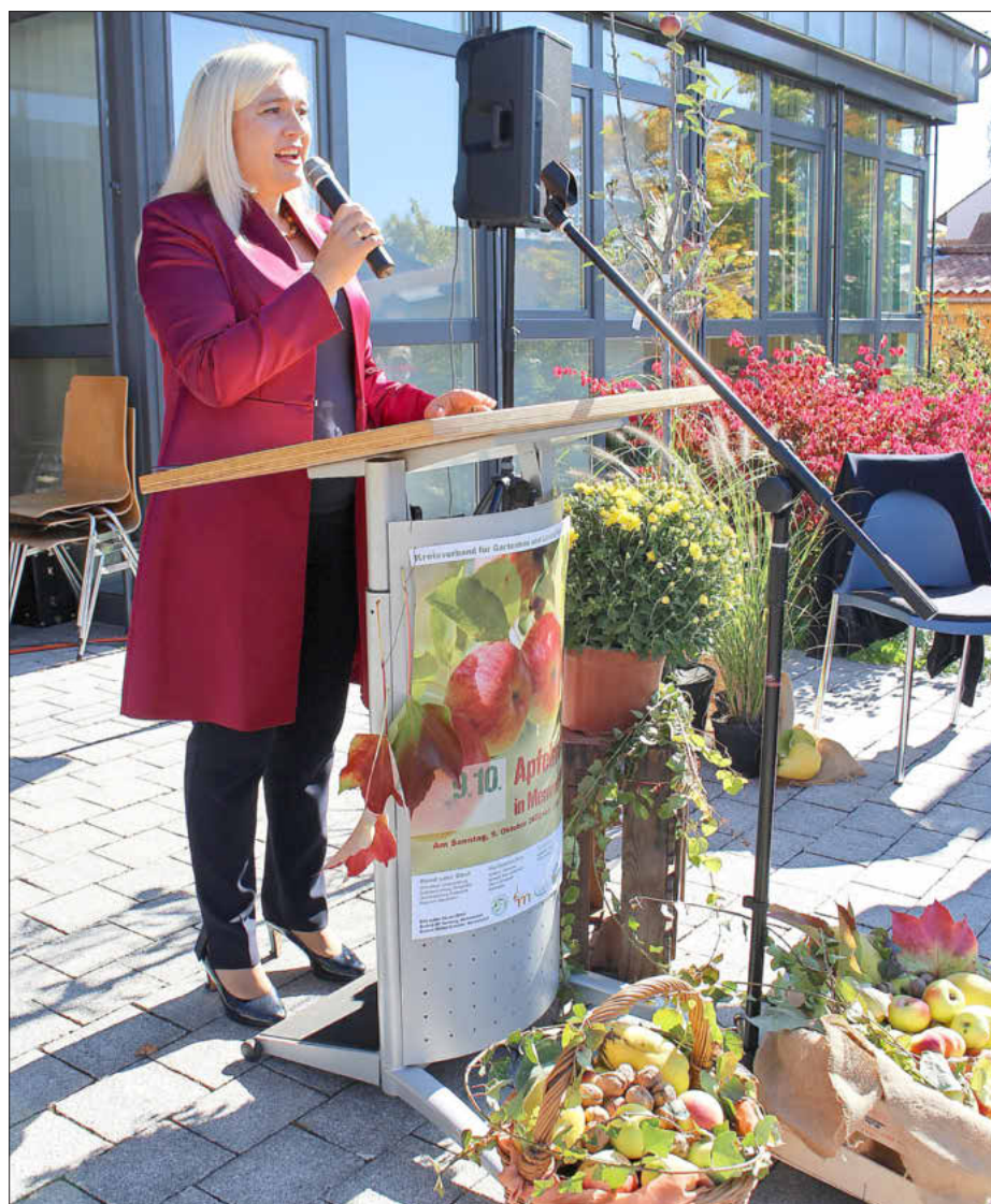
Staatsministerin Melanie Huml, MdL, beim Grußwort