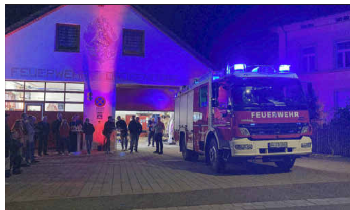
Lange Nacht bei der FF Drosendorf