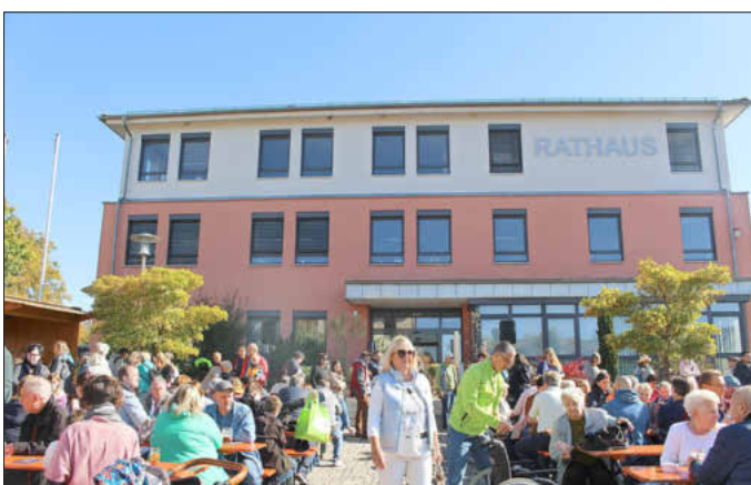
Buntes Markttreiben direkt am Rathaus

Von einem für Alle erfolgreichen Apfelmarkt spricht man dann, wenn viele engagierte Aussteller und Vereine mit einem bunten und abwechslungsreichen Rahmenprogramm rund um den Apfel und Streuobst zeigen, dass Landschafts- und Naturschutz auch noch hervorragend schmeckt und allen riesig viel Spaß macht! So wie am Sonntag in Memmelsdorf.