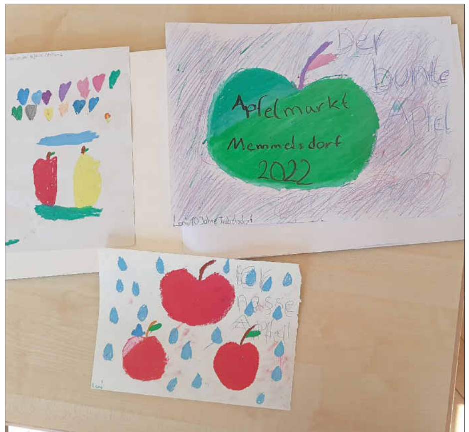
Der Apfelmarkt aus Kindersicht

Aigner selbst, dem in den letzten Kriegstagen bei einem Marsch der Dachauer Lagerhäftlinge die Flucht gelang, starb am 5. Oktober 1966 im 81. Lebensjahr im Freisinger Krankenhaus in der Folge einer schweren Lungenentzündung.