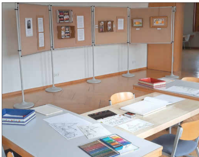
Die Ausstellung unseres Heimatpflegers Rüdiger Klein im Bürgerhaus zum „Apfelfarrer“ Korbinian mit Malvorlagen für Kinder