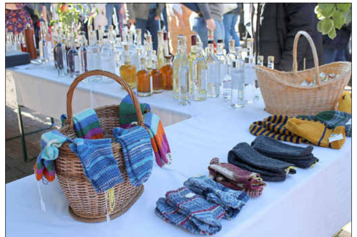
Buntes Sortiment am Marktsonntag