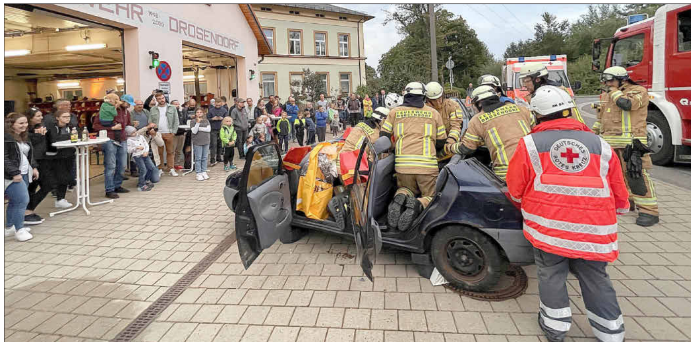
Lange Nacht bei der FF Drosendorf, Foto: © Kreisbrandinspektor Jörg Raber mit freundlicher Genehmigung durch die Feuerwehr Drosendorf

Erstmalig fand in diesem Jahr in ganz Bayern ein Werbetag für die Feuerwehr statt, ausgerufen vom Landesfeuerwehrverband. Die interessierten Feuerwehren konnten sich an einem sehr umfangreich ausgearbeiteten Konzept orientieren oder natürlich auch selbst Inhalte generieren. Insgesamt beteiligten sich 17 Feuerwehren im Landkreis Bamberg.