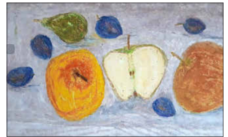
Ein Apfelbild nach Korbinian Aigner, Grafik: privat

erschüttert zurückschrecken vor der Menschen- und Schöpfungsfeindlichkeit der National-sozialisten.