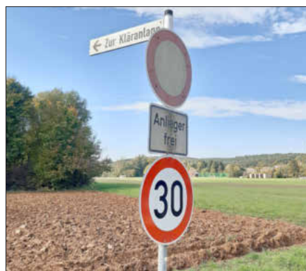
Diese Beschilderung bedeutet „Verbot für Fahrzeuge aller Art“ und nur für „Anlieger frei“