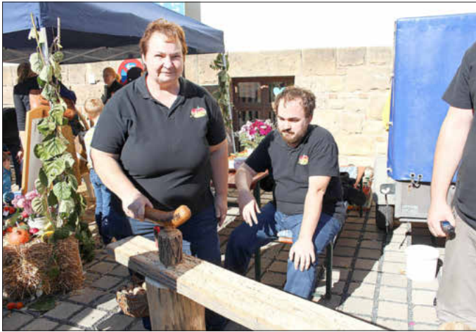
Die Pödeldorfer „Nußknacker“