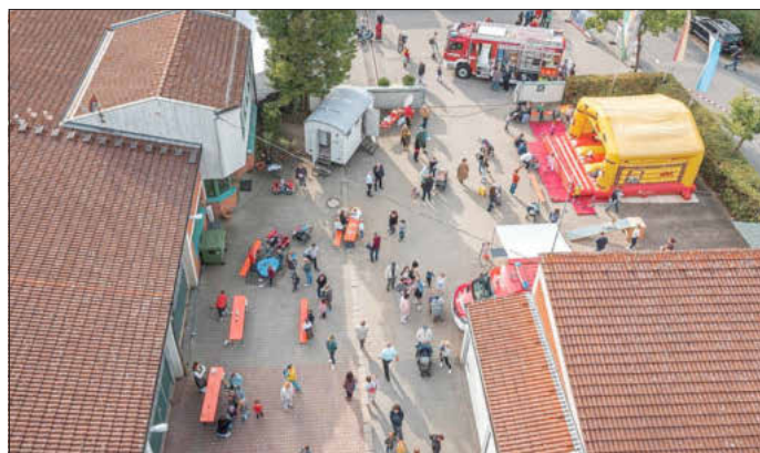
Impression aus der „Langen Nacht der Feuerwehr“ 2022 bei der FF Memmelsdorf, Foto: © Kreisbrandinspektor Jörg Raber mit freundlicher Genehmigung durch die Feuerwehr Memmelsdorf

Die Feuerwehren suchen immer wieder interessierte Neuzugänge jeden Alters und Geschlechts für ihre Ortsfeuerwehren. Der Weg ist meist sehr einfach! Gehen Sie auf ihren örtlichen Kommandanten zu, die Gemeindeverwaltungen helfen dabei gerne weiter. Oder besuchen Sie spontan eine Übung in ihrem Ort und sprechen die Aktiven direkt an. „Helfen kann JEDER!“ und „Helfen ist Trumpf!“