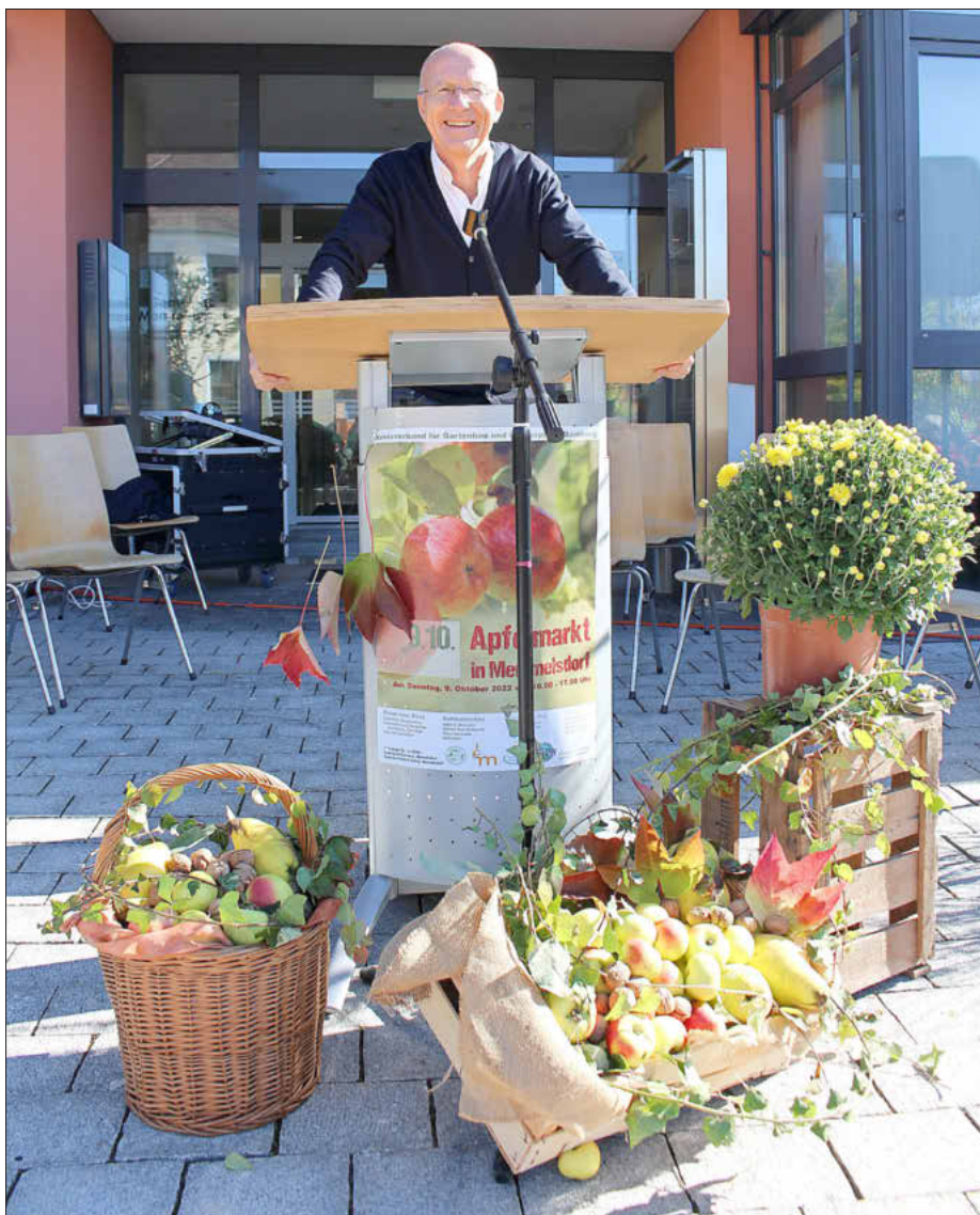
Erster Bürgermeister Gerd Schneider begrüßt zahlreiche Besucher*innen und hochrangige Gäste beim Memmelsdorfer Apfelmarkt

Aus Nah und Fern strömten die Besucher in das „Apfeldorf“ nach Memmelsdorf