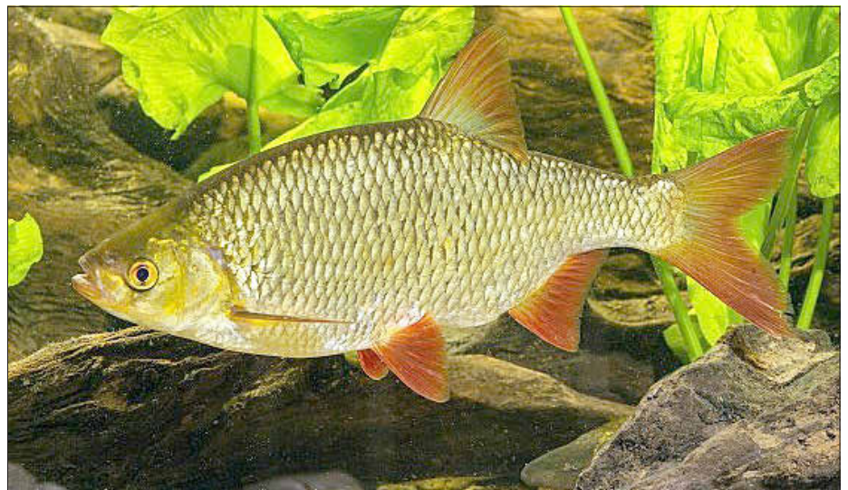
Die Rotfeder