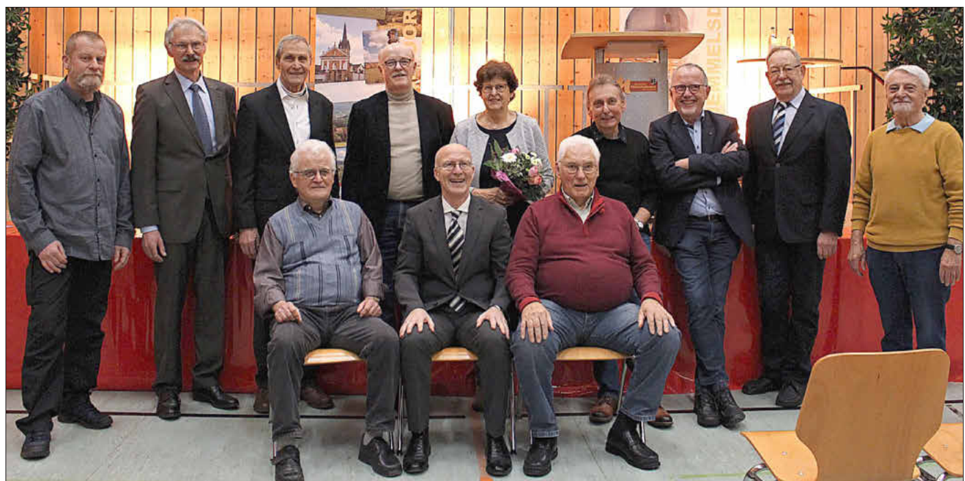
Die Geehrten des SCM-Einkaufsbusses