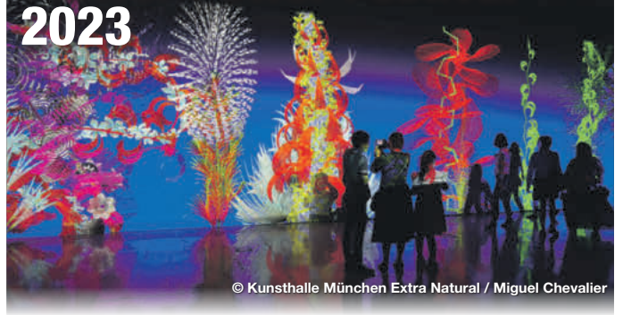
Extra Natural / Miguel Chevalier