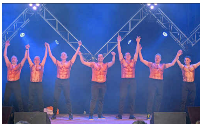
Immer wieder zum Brüllen komisch und auch was fürs Auge: das MCC-Männerballett hat beim Sixpack aber offensichtlich nachgeholfen