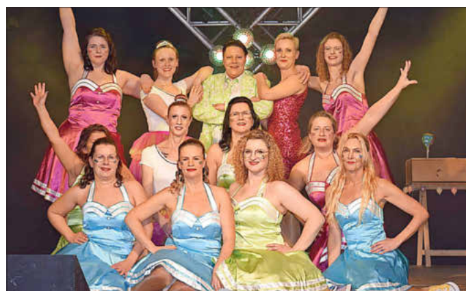
Zu vorgerückter Stunde bewiesen die knallbunten und quietschfidelen „MCC-Mams“, dass Eleganz und Liebe zum Tanz keine Frage des Alters ist