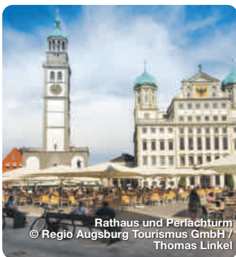
Rathaus und Perlachturm

TreffpunktDeutschland.de/ bayerisch-schwaben