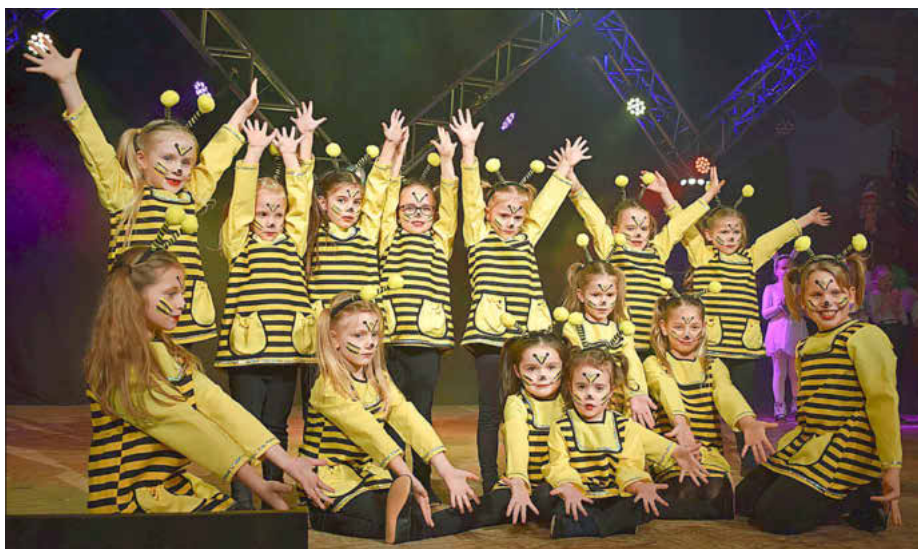
Bereits die „Tanzmäuse“ legten sich mächtig ins Zeug und bezauberten mit ihrem Tanz zu Motiven aus Biene Maja das Publikum