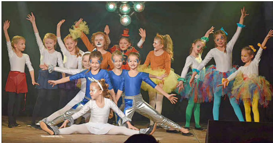
Die Bambinis präsentierten ihre bunte Zirkus-Show