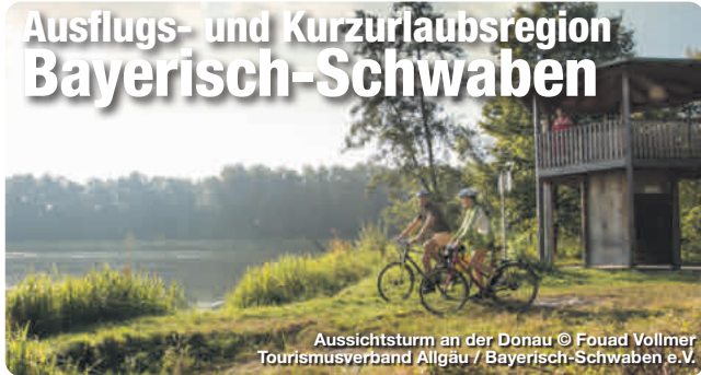
Aussichtsturm an der Donau

Bayern plus Schwaben macht Bayerisch-Schwaben. Vom Nördlinger Ries über das Schwäbische Donautal, die UNESCO-Welterbestadt Augsburg und das LEGOLAND® bis ins Wittelsbacher Land entdecken Besucher die vielseitige Region in den unterschiedlichsten Facetten: Hier „schwätzt“ Bayern schwäbisch und Schwaben bayerisch. Radwege in idyllischen Flusslandschaften sowie Wander- und Themenwege durch die vielfältige Natur machen die Region zu einem beliebten Ziel für große und kleine Aktivurlauber. Zwischen prächtig-glanzvoll und verträumt-gemütlich präsentieren sich die Städte und Orte Bayerisch-Schwabens.