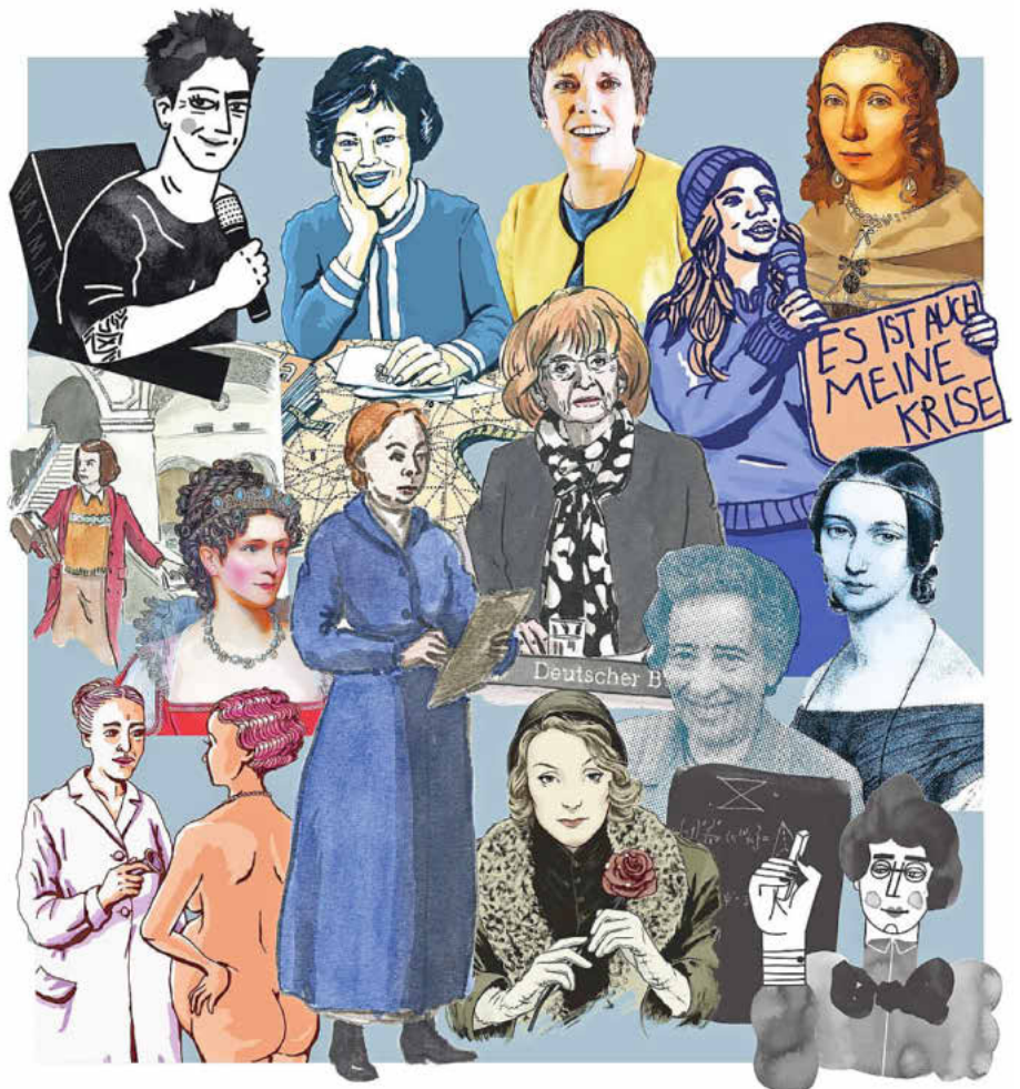
Plakat zur Ausstellung „Rebellen - Frauen verändern die Welt“