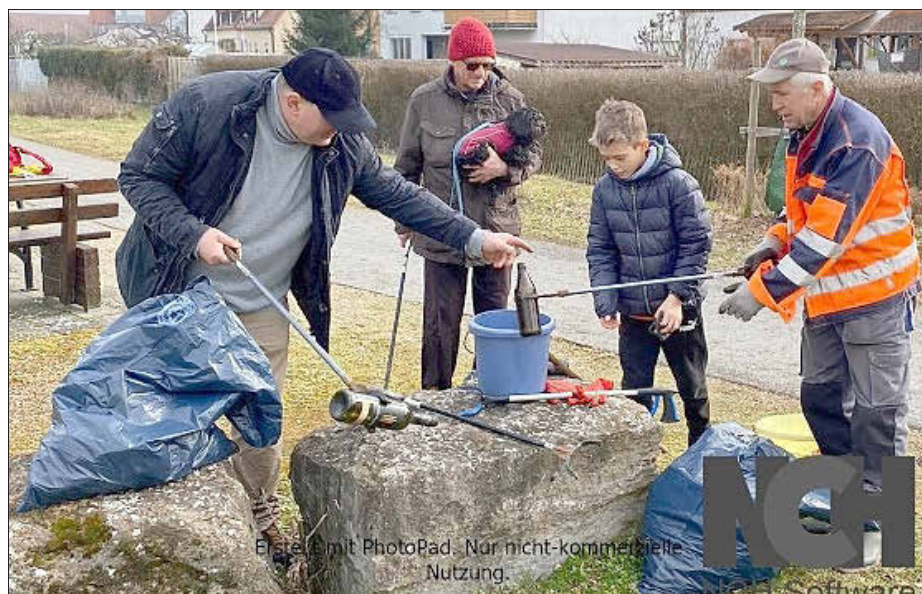
Erstellt mit PhotoRad. Nur nicht-kommerzielle Nutzung.

Übrigens, den Kindern und Eltern, die schon am Rosenmontag eine Sammelaktion in einem Teilbereich durchgeführt haben, ein herzliches Dankeschön!