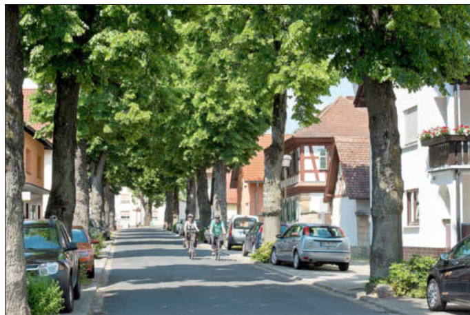
Die Lindenallee in Strullendorf – 1926 als lebendiges Denkmal gepflanzt, prägt sie seit 100 Jahren das Ortsbild.

Im Anschluss an die Führung öffnet ab 15:00 Uhr der Historische Kulturbauernhof in der Schulgasse in Strullendorf seine Pforten zur individuellen Besichtigung. Eine Fotoausstellung des Heimatkundlichen Verein Zeegenbachtal e. V. und ein Schülerprojekt der Grund- und Mittelschule zum Jubiläum der Lindenallee können ebenfalls betrachtet werden. Für Kaffee und Kuchen ist gesorgt!