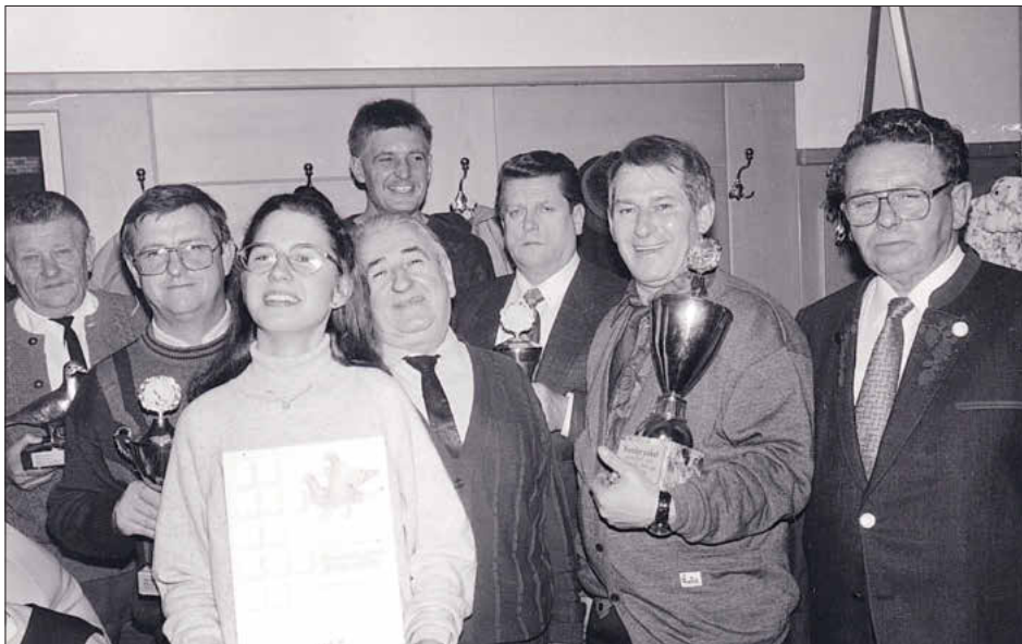
Ehrung der Vereinsmeister für das Flugjahr 1991 in der Gastwirtschaft Göller.