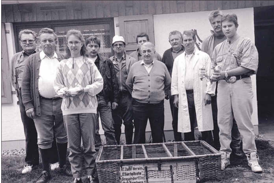
Beim Einsetzen der Tauben 1991